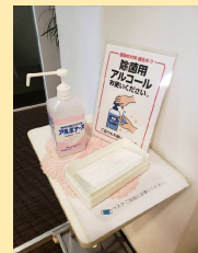
未着用の方へマスクをお渡ししております。