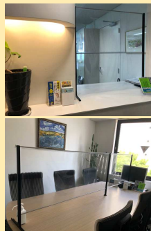
飛沫感染対策パーテーション設置

弊法人では緊急事態宣言期間中にテレワークを実施しておりました。テレワーク環境の整備、感染症対策への対応はお客様は勿論、周囲の話を伺うと、従業員の会社への不満に繋がる場合があるようです。必要であればパンフレットお渡します!