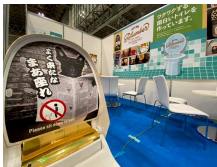
とてもユニークな商品 「よく来たな まあ座れ」