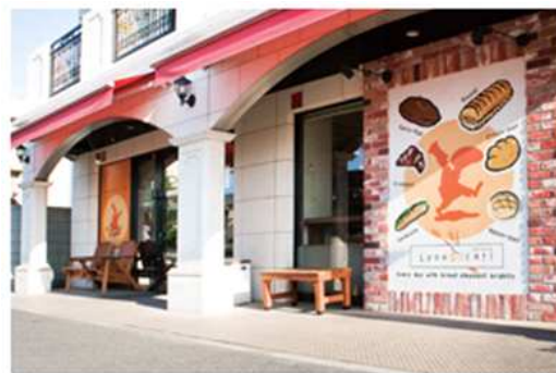
株式会社プラスパン リヨンソレイユ 東京都江戸川区瑞江4-21-8 都営新宿線瑞江駅より徒歩5分