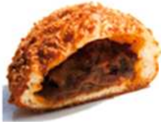
「牛肉ゴロゴロカレーパン」

是非一度、焼き立ての『牛肉ゴロゴロカレーパン』食べてみたいものです。 近くに立ち寄った際にはぜひ!